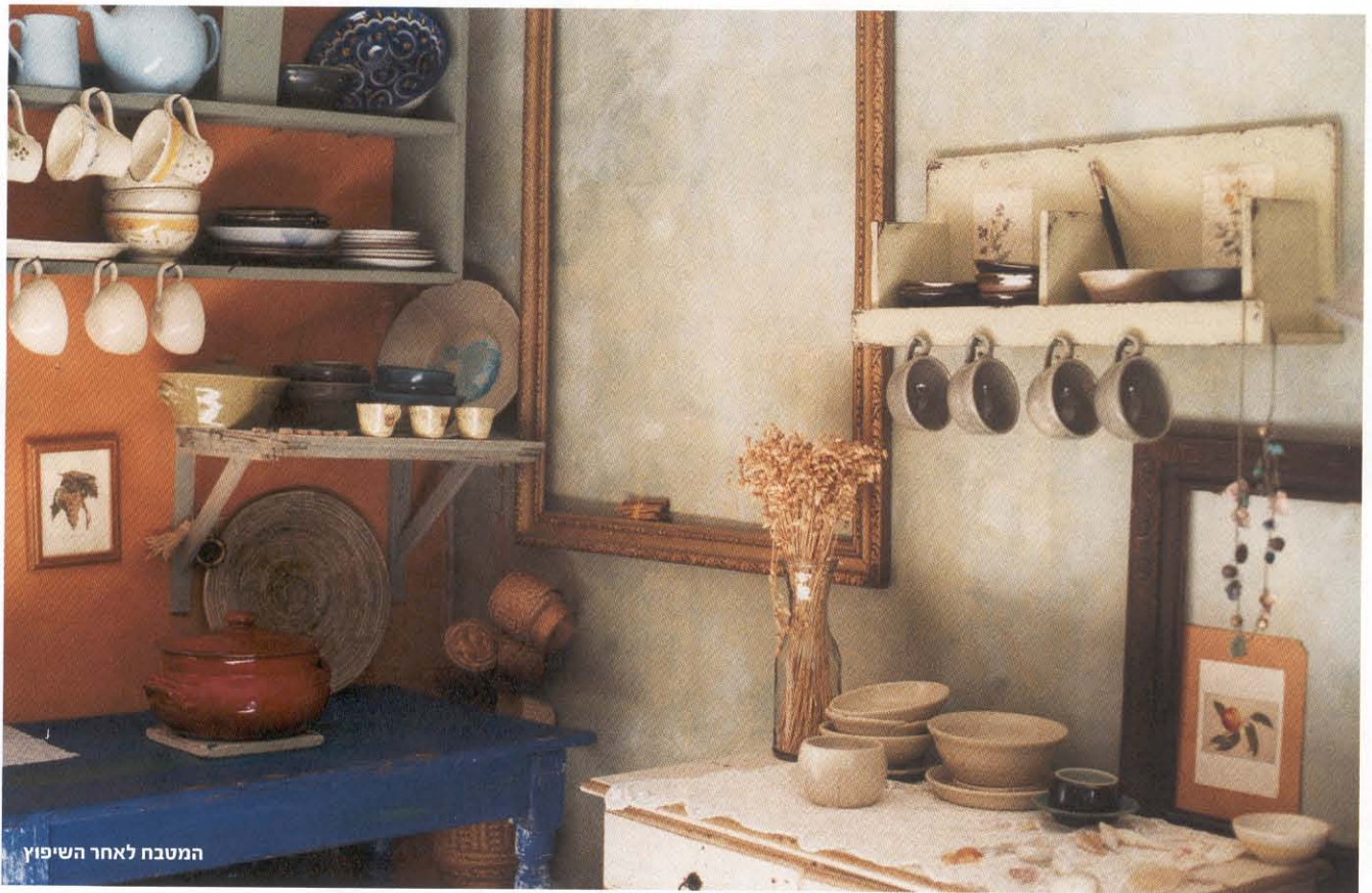
המטבח לאחר השיפוץ

"הצבעוניות וריבוי החפצים יוצרים יחד אוסף מעניין ושונה מהמוכר ברוב הבתים. השילוב הזה כל כך מושך ומחמם, עד שאי אפשר שלא להרגיש בבית"