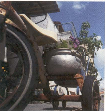
אוסף העציצים והפריטים הישנים, שמוצב על המדרכה בצמוד לבית