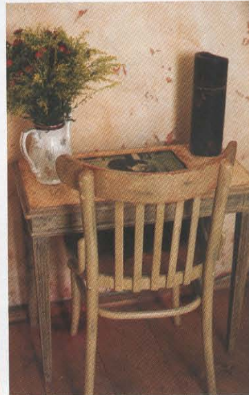
כסאות ש"טופלו" בטכניקות שונות: גילדינג, דיסטרסינג, קרקל גלייז וטיח מרמרינו

רצפת פרקט - עץ גלריה פשוט, שהוקצע והונח על לוחות התשתית הקיימת. לוחות הדיקט הוסרו מהקירות, והמקומות הנגועים ברטיבות טופלו, נאטמו והתייבשו. לאחר מכן כוסו הקירות בטיח ווגה (טיח מינרלי גס) בטקסטורות שונות ובגוונים שונים, וכן בטיח מרמרינו לקבלת מראה כפרי חם. את בחירת הגוונים בהם נצבעו הקירות מסבירה דקלה: "לאזור המטבח בחרנו צבעים חמים ומעוררי תאבון - כתום, כחול וירקרק. בסלון ובחדר השינה העדפנו צבעים רגועים יותר, כמו הלבנים, צבעי החול והירקקים אפורים".